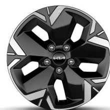
Jante aliaj de 17''

*Imaginile afișate au caracter ilustrativ. Culoarele pot varia în funcție de culorile monitorului și pot apărea diferite în comparație cu produsul real.