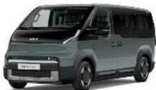
Lakehouse Gray (LHG)