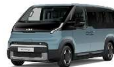
Frost Blue (EBB)