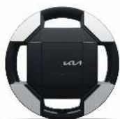
Jante aliaj - 16"