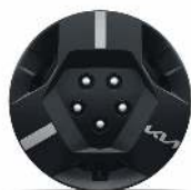
Jante oțel - 16"