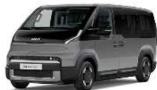
Steel Gray (Gloss) (KLG)