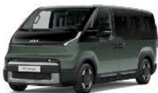
Cityscape Green (CGE)