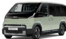
Soft Mint (SML)