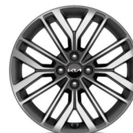
Jante aliaj 17" (C)