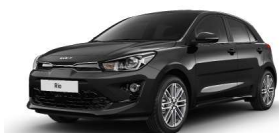
Aurora Black Pearl