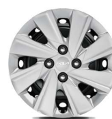
Jante oțel 15"