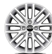
Jante aliaj 15"