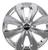
Jante aliaj 16"