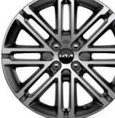
Jante aliaj 17"